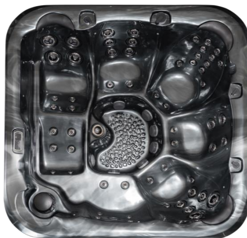
Ovan, Pearl shadow